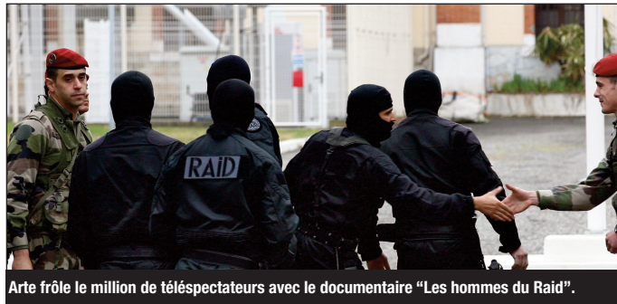
Arte frôle le million de téléspectateurs avec le documentaire "Les hommes du Raid".

Mardi soir, sans surprise, MTF1 a pris largement la tête du classement avec la série américaine "Mentalist" dont les deux premiers épisodes sur les quatre diffusés ont été regardés par 6,1 millions de fans soit 26,9% de PDA selon Médiamétrie. Le premier inédit a séduit près de 7,5 millions de téléspectateurs. Suivent France 2 et France 3 avec plus de 3,1 millions de téléspectateurs pour "Secrets d'histoire" et le téléfilm "Au revoir... et à bien-