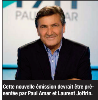
Cette nouvelle émission devrait être présentée par Paul Amar et Laurent Joffrin.

Paul Amar à la présentation, Christophe Barbier et Laurent Joffrin comme participants. Voilà le plateau que pourrait réunir l'émission politique que préparent les équipes de Patrick Drahi depuis plusieurs mois, selon une information de La Tribune. Le directeur de la rédaction de Libération et celui de L'Express, ainsi que Paul Amar, récemment nommé à la tête de la chaîne d'informations israélienne i24News, vont s'unir pour cette émission, qui serait diffusée en direct le dimanche matin, afin d'interroger des personnalités